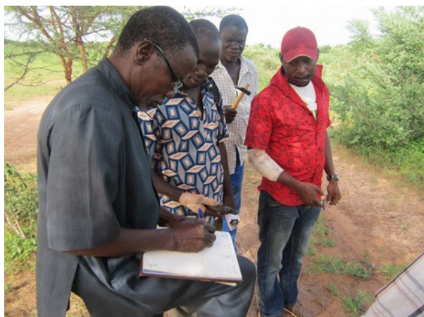
Messurage du terrain du centre psychosocial

En conséquence des voyages d'étude aux installations de St. Camille en Côte d'Ivoire et au Bénin l'association Yenbaabima a décidé à abandonner le terrain 3 km hors de la ville qui était d'abord avisé pour un centre psychosocial. Très vite un autre terrain était trouvé et déjà acquis. Il est situé près de la ville. Le nouvel terrain est même plus grand que l'ancien. Pendant le séjour des Burkinabés à Stetten en Juin nous avons déjà évoqué la question de la site. À Waiblingen et à Stetten ils ont expérimenté l'intégration des centres pour les handicapés dans la ville. Il n'était pas à nous à donner des conseils pour la région rurale de Piéla. On se pose la question s'il sera nécessaire à protéger les malades des craintes irrationnelles et du rejet traditionnel par la population. Nous sommes très contents de la décision courageuse pour la nouvelle site montrant la prise de position pour les malades !